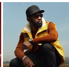
Passi ©Andrew Kumi